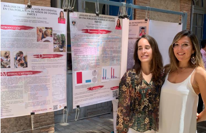
En el momento de la defensa