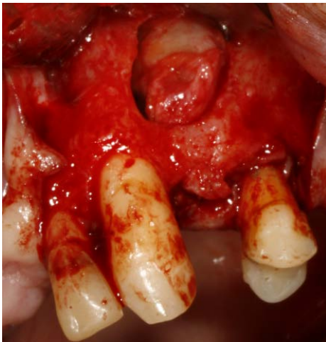
Figura 2. Despegamiento de la membrana quística