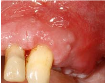
Figura 5. Retirada de sutura