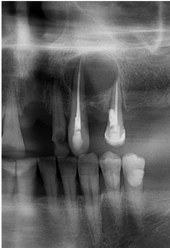
Figura 1. Imagen radiolúcida periapical.